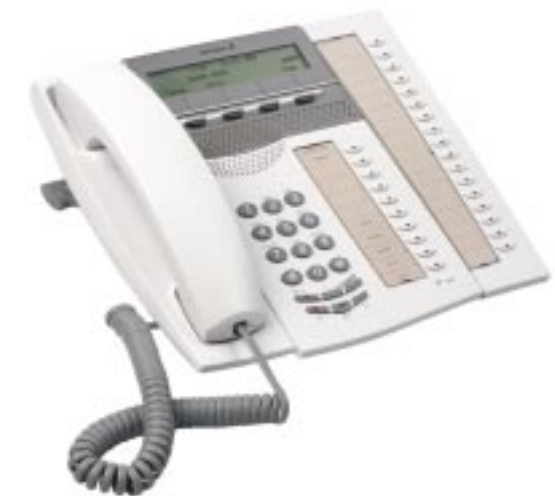
MD Evolution System telephone