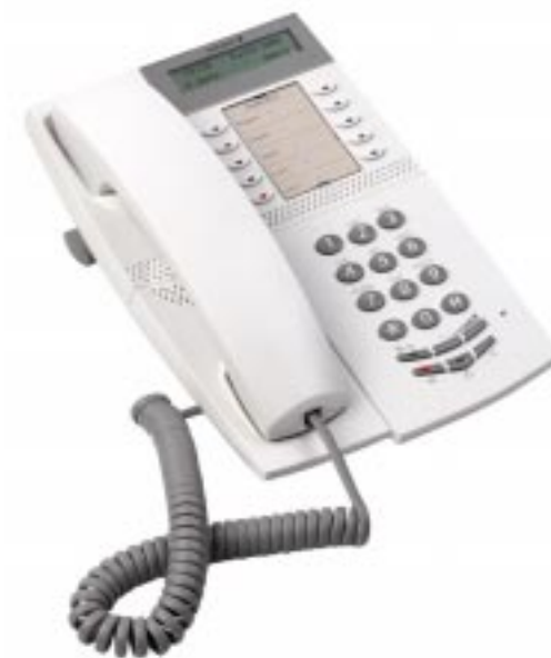
MD Evolution System telephone